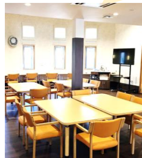
共有スペースとしてご利用いただける食堂・コミュニケーションルーム