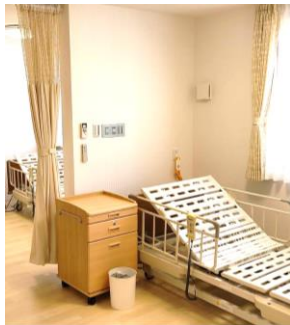
2人部屋 6室 3人部屋 1室