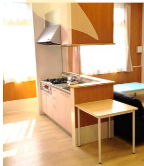
生活動作の改善と自立度の向上のための環境が整っています。