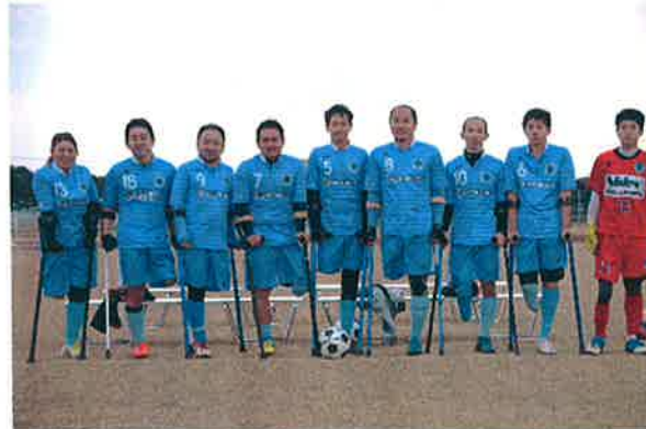
アンプティサッカーVS知的障がい者サッカーエキシビジョンマッチ