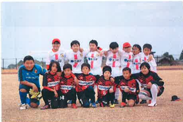
弱視児童の初試合は大敗・・・